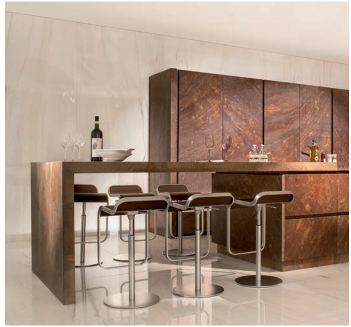
Bühne frei: Auch diese Küche fungiert als räumliche Bühne in der Ausstellung. Hierfür wurde das Material Cabernet-Brown-Granit verwendet.

anschliessenden Ideenfindung entstehen zügig erste Raum- und Farbkonzepte. Vielfach erfolgt bereits eine primäre Materialwahl. Bei aufwendigeren Projekten werden Visualisierungen erstellt, um der Kundschaft differenzierte Raumeindrücke zu vermitteln. Nach der Erstellung einer Offerte und der Zusage durch den Bauherrn findet der Startschuss zur definitiven Planung wie die detaillierte Steinteilung, die Materialbeschaffung sowie die Stückbearbeitung statt. Schliesslich erfolgt die Montage vor Ort und die Endabnahme. Am Ende dieses komplexen Prozesses steht jeweils ein überzeugendes und auf den Kunden und die Bauaufgabe abgestimmtes Ergebnis.