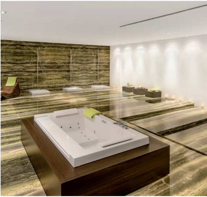
Faszination Naturstein: Der Irish-Green-Marmor, poliert, wurde hier in einem Badezimmer eingesetzt, das Teil der Ausstellung in Gibswil ist.