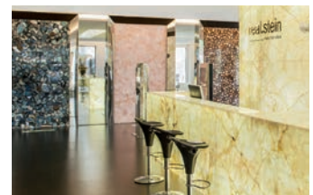
Der Real-Stein-Sitz in Gibswil im Zürcher Oberland.

und so die Oberflächenbeschaffenheit selbst spüren. Um zu entdecken, wie die Natursteine grossflächig wirken, gestaltete das Unternehmen einen 600 m 2 grossen Ausstellungsbereich als räumliche Bühne, wo die robusten Akteure auf vielfältigste Weise zu erleben sind. Mit der vielseitigen Ausstellung werden beim Besucher Emotionen geweckt. In der Empfangshalle beispielsweise setzte man grossflächige Onyxsteine gekonnt ins rechte Licht. Durch die hinterleuchteten Steine entsteht ein einzigartiges, farbdurchflutetes Raumambiente. Die einzelnen Steinplatten mit ihren Farb- und Strukturkompositionen avancieren zu Kunstwerken von Mutter Natur. ▲▲▲